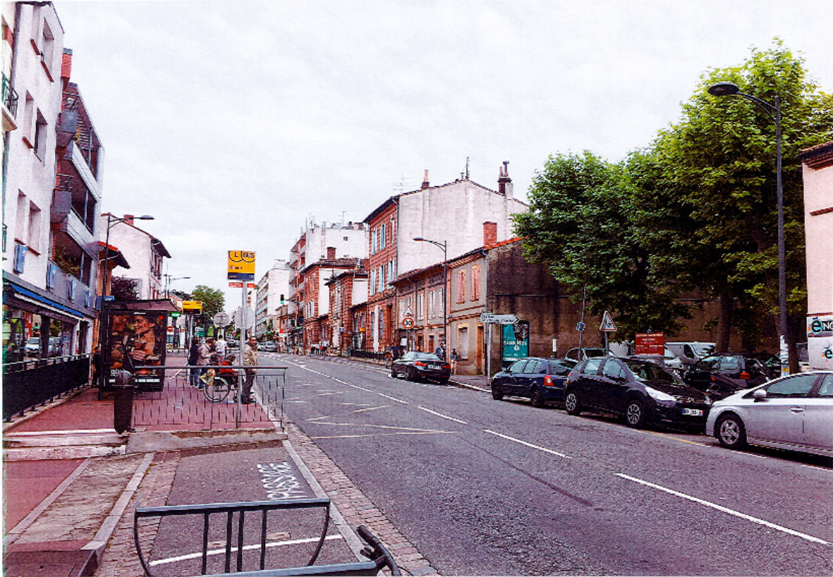
Vue à partir du bas après aménagements (photo-montage)