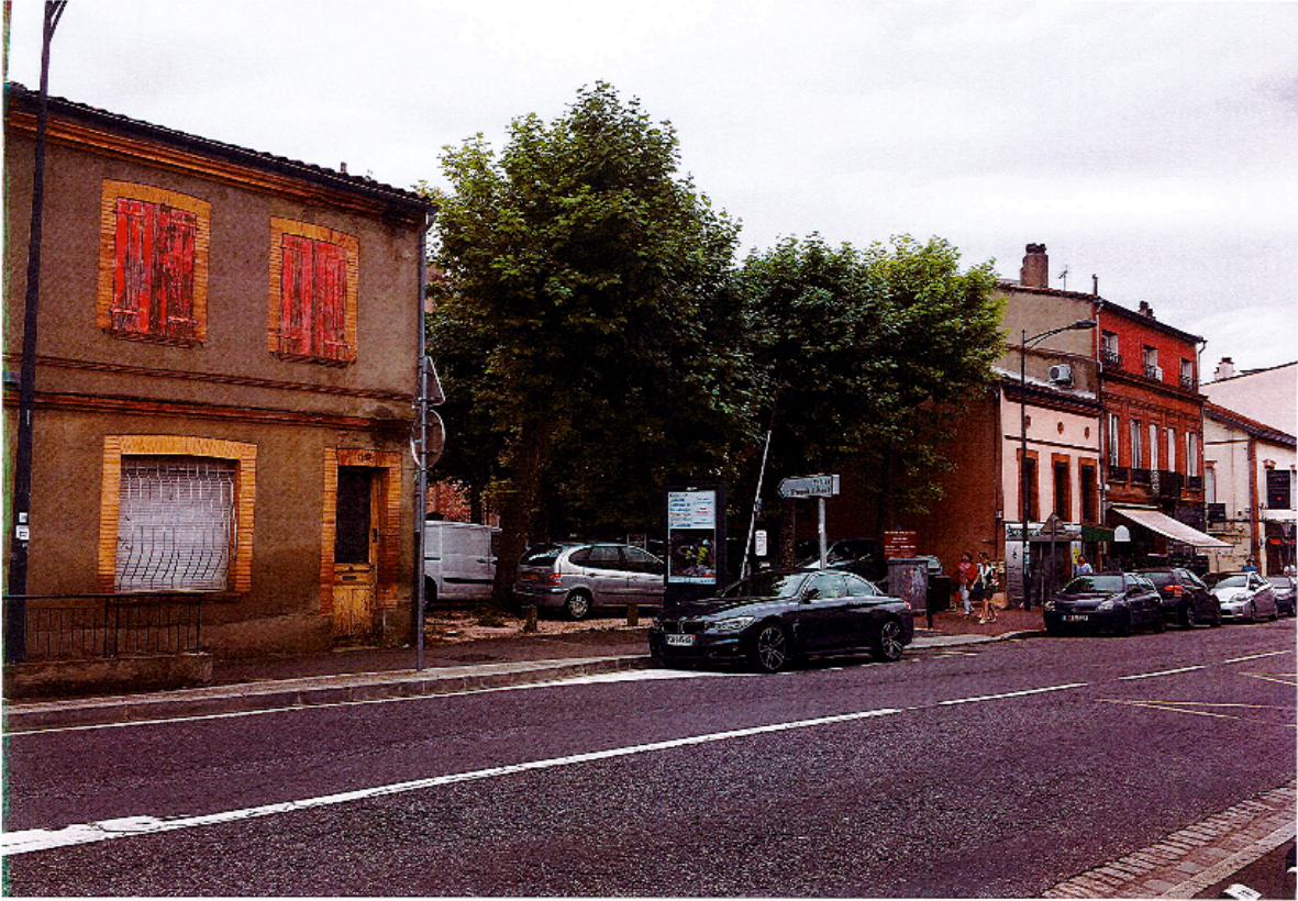
Vue à partir du haut après aménagements (photo-montage)